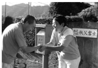
〈衆議院選挙での活動〉