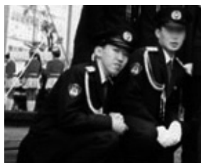
〈地域の安全を守っていた警察官時代〉