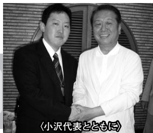
〈小沢代表とともに〉